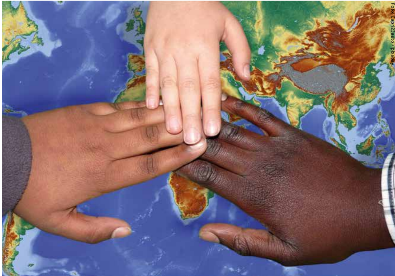
„Migrant ist nicht gleich Migrant“

Wissenschaftler wollen herausfinden, wie sich die psychoonkologische Versorgung von Patienten mit Migrationshintergrund und ihren Angehörigen verbessern lässt. Die gezielte Befragung von Betroffenen soll zeigen, welche Unterstützung Krebspatienten aus verschiedenen Regionen und Kulturen sich wünschen und wie Ärzte den jeweiligen Versorgungsbedarf ermitteln können. Der Schwerpunkt der Untersuchung liegt auf Patienten aus dem außereuropäischen Raum.