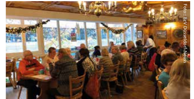
Weihnachtsfeier in Neuss