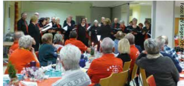
Stimmungsvoller Gesang von sono Vocale

„Auch hier ist heute etwas los, beim Weihnachtstreff der Kekolos. Wir treffen uns im Bürgerhaus mit Programm zum Weihnachtsschmaus. Und sitzen hier in lock'rer Rund' am Nachmittag für ein paar Stund“.