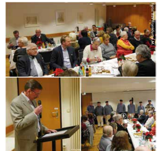
Shanty-Chor und viele Teilnehmer auf der Weihnachtsfeier