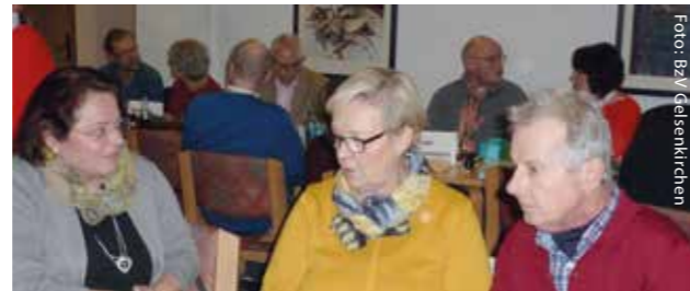
Reger Austausch auf der Weihnachtsfeier

Der Bezirksverein und Umgebung führt jedes Jahr eine Sonderveranstaltung mit einem speziellen Thema durch, das vertieft behandelt und diskutiert wird. Im Jahr 2019 wurde auf Wunsch der Mitglieder das heikle Thema