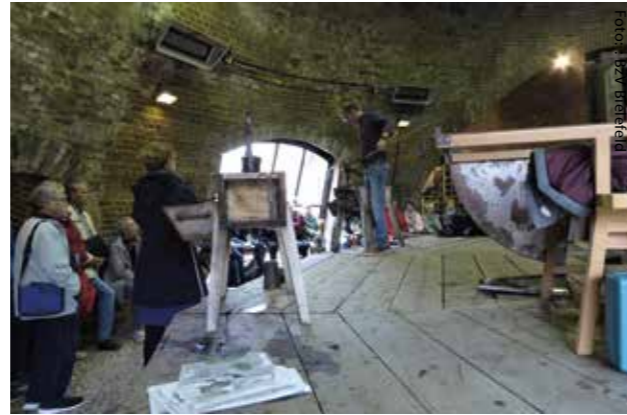
Vorführung im Glasmuseum

Am 17. Oktober 2019 fand unser Herbstausflug zur Glashütte nach Petershagen an der Weser statt. Das erste Ziel war ein Restaurant in einem denkmalgeschützten alten Bahnhof. Dort wurden wir zu einem bayerischen Mittagessen erwartet. Frisch gestärkt ging es weiter zum Industriemuseum „Glashütte Gernheim“. Unter sachkundiger Führung bekamen wir die Produkte der Glashütte, aber auch die Siedlungshäuser der Glasbläser und deren Familien zu sehen. Weiter ging es zu dem eindrucksvollen riesigen Glashüttenturm, der im Jahr 1826 als Technisches Highlight erbaut wurde. Durch die damals neuartige kegelförmige Bauart konnte der Rauch sehr schnell durch die Öffnung an die Spitze entweichen, gleichzeitig wurde viel Frischluft von unten in den Glas-Schmelzofen gesogen. Im Turm wurde uns die Herstellung der Gläser erläutert und wir konnten das Werden von Flaschen, Vasen und Bechern verfolgen - eine spannende Sache. In der Schleiferei zeigte man uns, wie Ornamente und Muster auf die oft farbigen Gläser aufgebracht wurden; etliche prachtvolle Objekte konnten wir anschließend im Museum bewundern.