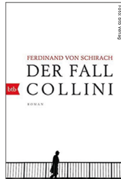
Ferdinand von Schirach: Der Fall Collini. btb Verlag München, 7. Auflage 2017, 195 Seiten, 10 Euro

satz für ihn war. Der Täter schweigt zu seinem Motiv. Leinen muss also einen Mann verteidigen, der nicht verteidigt werden will. Erst ein Bäcker überzeugt ihn davon, dass er als Rechtsanwalt trotzdem tun müsse, was Rechtsanwälte tun: verteidigen. Und erst nach vielen schlaflosen, vom Durcharbeiten der Akten und Unterlagen bestimmten Nächten, findet der junge Anwalt eine Spur zum Motiv des Mörders. Sie führt in die Vergangenheit, in das Jahr 1943 in Italien. An diesem Fall zeigt Ferdinand von Schirach: Die Welt ist nicht schwarz und weiß, bevölkert von reinen Tätern und reinen Opfern. Am Ende zitiert der Autor die Ergänzung des § 50 StGB vom 1.10.1968, die die Strafbarkeit beteiligter Einzeltäter an Gemeinschaftsverbrechen, wie denen der Nationalsozialisten, mildern kann. Das Opfer von heute ist der Täter von gestern, der nicht mehr zur juristischen Verantwortung gezogen werden konnte.