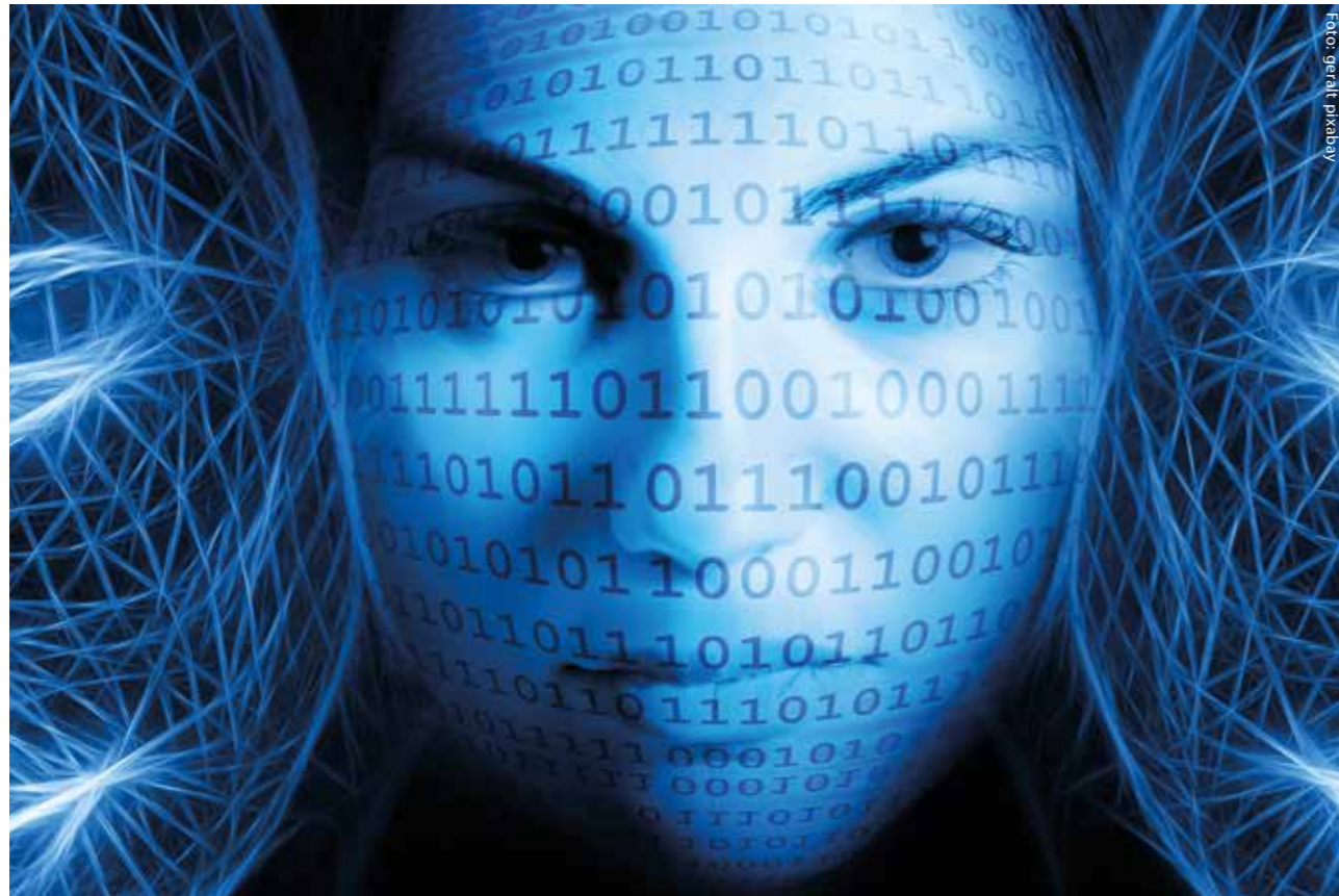
Datensicherheit im Gesundheitswesen schützen

Im Januar 2020 ist das „Gesetz für eine bessere Versorgung durch Digitalisierung und Innovation“ (DVG) in Kraft getreten. Es soll die Online-Vernetzung im Gesundheitswesen systematisch vorantreiben und die Entwicklung digitaler Produkte anreizen. Beschlossen ist außerdem der Aufbau einer zentralen Datenbank, in der Informationen über alle gesetzlich Versicherten gespeichert und für Forschungszwecke bereitgestellt werden. Jens Spahn ist von seinem Gesetz überzeugt und kommentierte es im vergangenen Jahr so: „Wir wollen jetzt Geschwindigkeit machen, Geschwindigkeit, um unser Gesundheitswesen fit zu machen für die digitale Zukunft.“