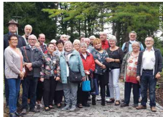
Seminarteilnehmer in Kirkel