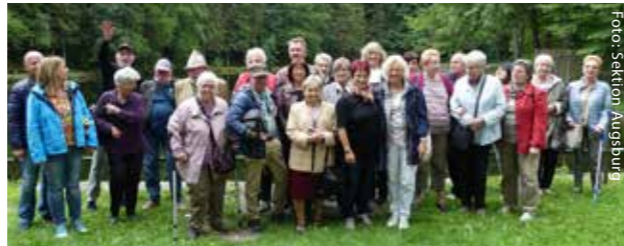
Gruppenfoto der Teilnehmer

Am Samstag, den 13. Juli 2019 fand unser Jahresausflug statt. Wir fuhren mit dem Bus von Augsburg nach Füssen. Nach einer rund zweistündigen Fahrt kehrten wir in einer Taverne ein. Anschließend fuhren wir mit dem Bus zur Bootsanlegestelle bei Füssen. Wir hatten eine kleine Bootsrundfahrt am Foggensee gebucht. Es fing etwas zu regnen an, hörte aber beim Anlegen wieder auf. Danach fuhren wir mit dem Bus zum Mittelsee und kehrten dort in einer Wirtschaft ein. Dort gab es Kaffee und Kuchen sowie Eisbecher. Manche nutzten die Zeit auch zu einem Spaziergang. Um 16.30 Uhr traten wir wieder unsere Heimreise an. Wohlbe-