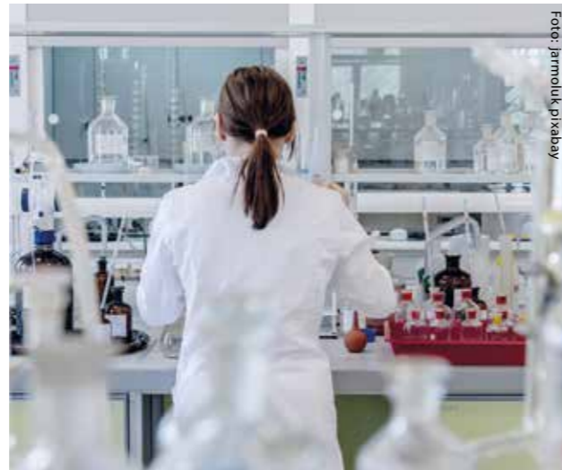
Steigende Zahl der Krebserkrankungen meldet das RKI

Diese 12. Ausgabe von „Krebs in Deutschland“ beruht auf Daten der bevölkerungsbezogenen Krebsregister bis zum Jahr 2016. Alle Bundesländer haben mittlerweile eine flächendeckende Krebsregistrierung aufgebaut. Dennoch können die Zahlen der Krebsneuerkrankungen in Deutschland nicht durch Zusammenzählen bestimmt