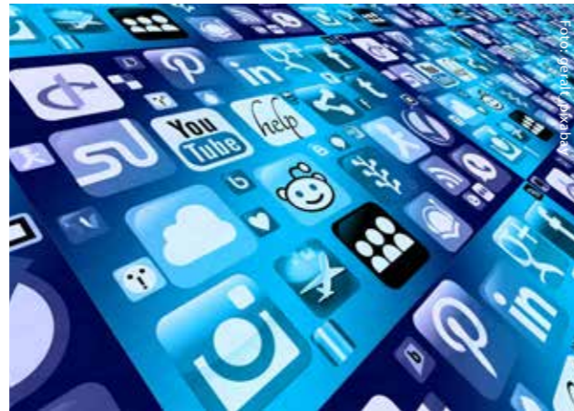
Selbsthilfe vernetzt sich digital

Die Nationale Kontakt- und Informationsstelle (NAKOS) warnt in diesem Zusammenhang auch vor dem so